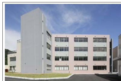
亀田医療技術専門学校